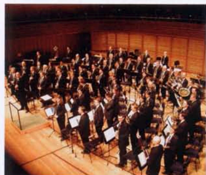
L'Harmonie lausannoise en formation de concert.

Le roman «Moby Dick», de l'écrivain américain Herman Melville, est l'un des chefs-d'œuvre de la littérature du 19 e siècle. Bien qu'il soit toujours difficile d'apporter une vision nouvelle d'une œuvre aussi connue, le compositeur Stephan Melillo y est parvenu en plaçant sous son microscope l'âme du capitaine, d'où le titre de sa pièce «Achab». Cette œuvre musicale n'est pas simplement une histoire récitée, mais une véritable pièce de théâtre dramatique, interprétée pour l'occasion par le renommé et talentueux