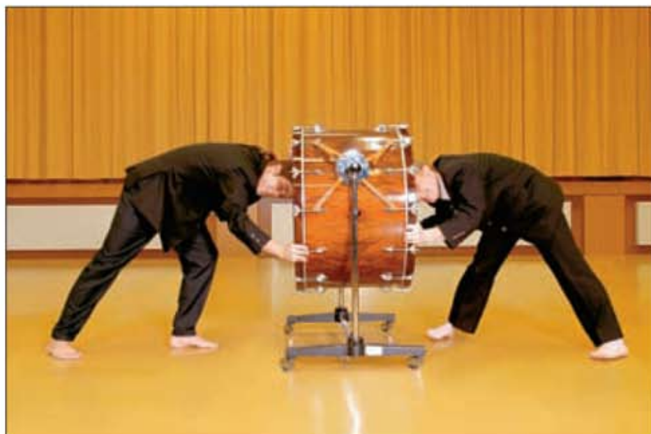
La percussion n'en perd pas la tête pour autant.