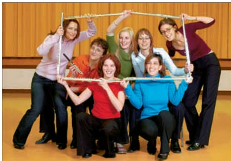
Les flûtistes de l'Harmonie lausannoise sont prêtes à se mettre en quatre.